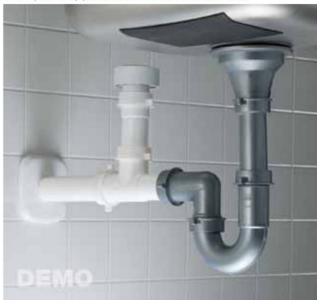
Esempio di applicazione al sifone del lavello