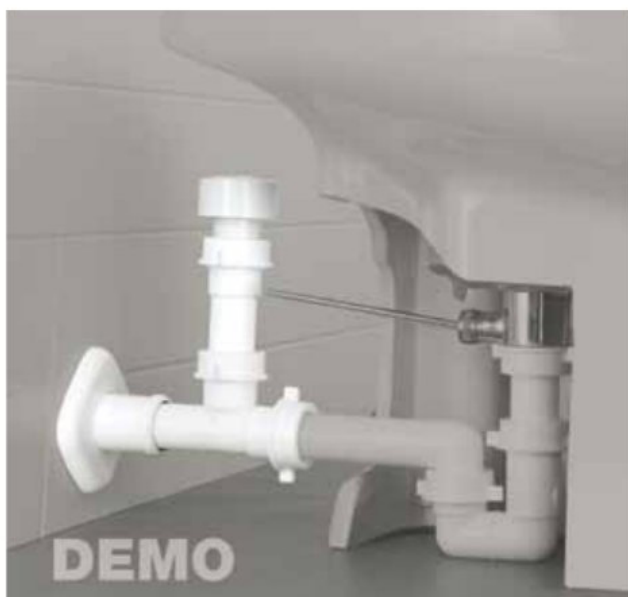
Esempio di applicazione al sifone del bidet

Una funzionalità sorprendente: Glu Glu Stop è disponibile in due differenti versioni: