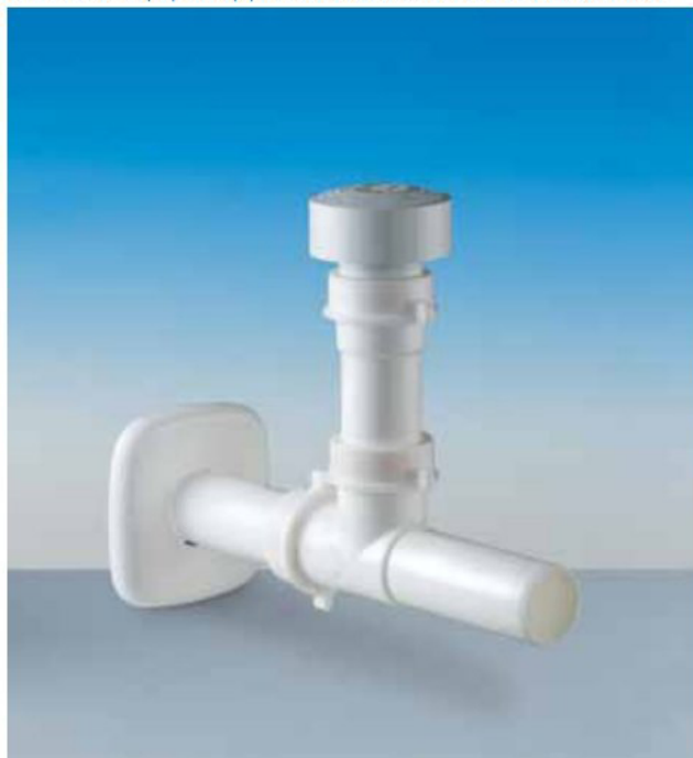
Glu Glu Stop per applicazione ai sifoni di lavelli cucina